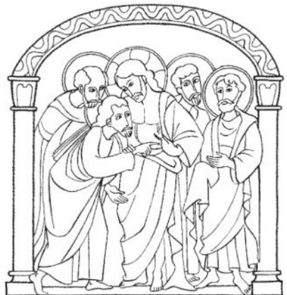
«Metti qui il tuo dito» Giovanni 20,27