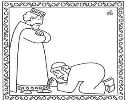
«Il servo, prostrato a terra, lo supplicava» Matteo 18,26

Appena uscito, quel servo trovò uno dei suoi compagni, che gli doveva cento denari. Lo prese per il collo e lo soffocava, dicendo: “Restituisci quello che devi!”. Il suo compagno, prostrato a terra, lo pregava dicendo: “Abbi pazienza con me e ti restituirò”. Ma egli non volle, andò e lo fece gettare in prigione, fino a che non avesse pagato il debito.